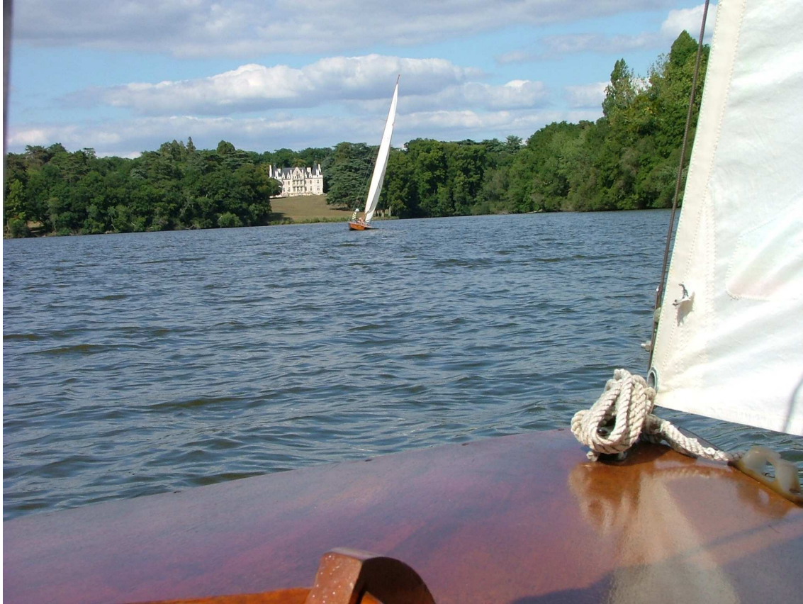
Le château de la Couronnerie