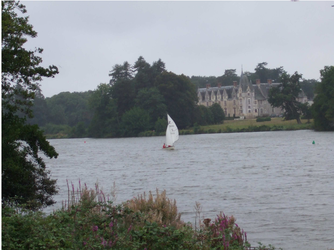
Le château de la Gascherie