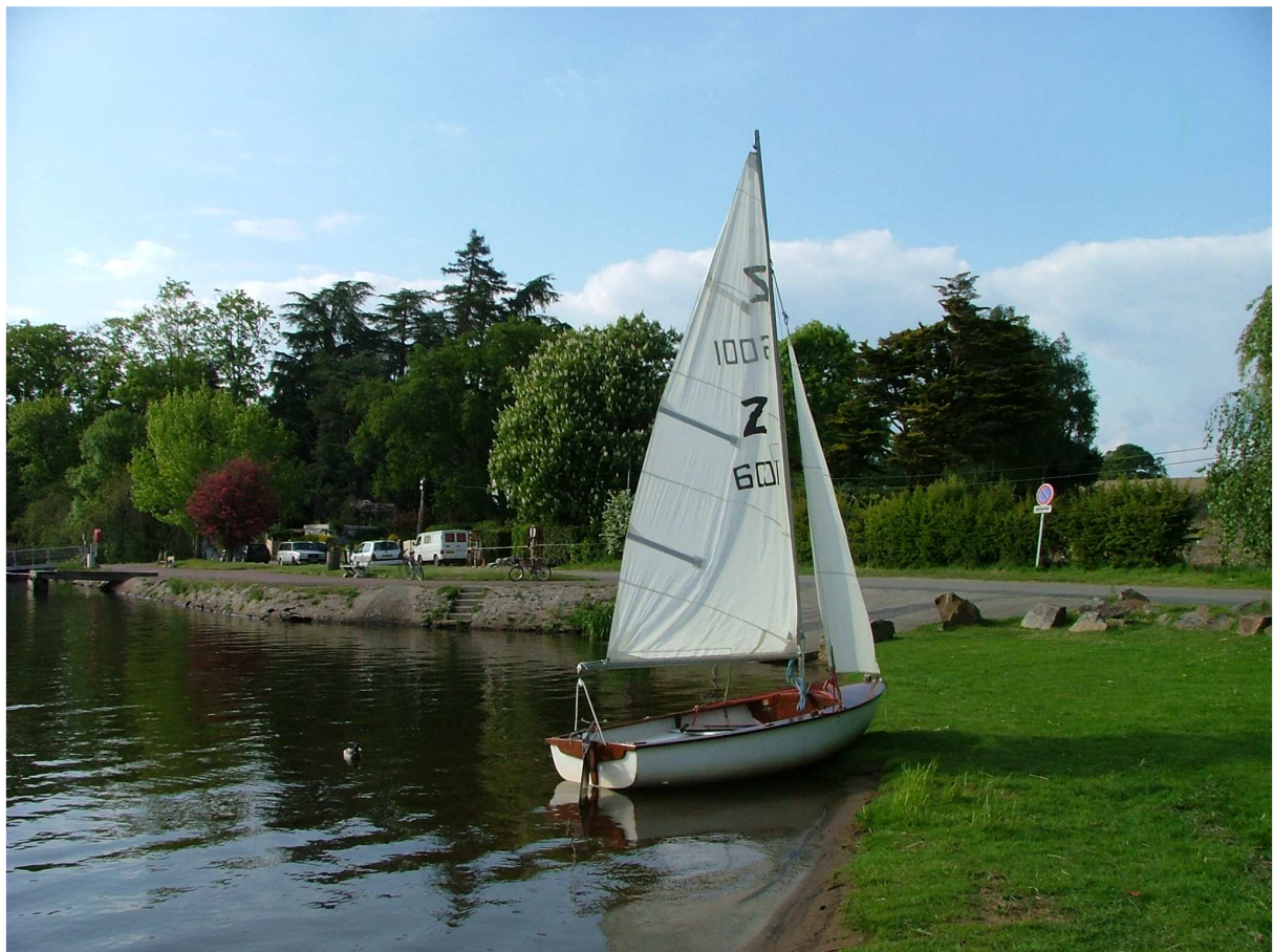
La plage de Port Jean