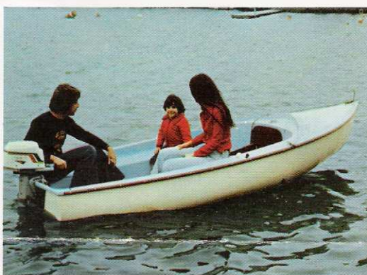
... ou un bateau de pêche et promenade

Sangles de rappel. Spinnaker 9 m 2 , targon de spinnaker, accessoires de spinnaker, girouette, écoute de grand'voile compétition, avirons et dames de nage. Taud de mouillage, remorque spéciale.